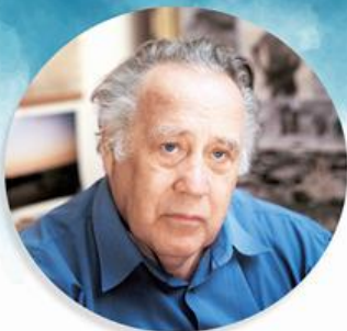
Владислав Петрович Крапивин

Конкурс проводится в целях мотивирования педагогической общественности к изучению литературного и педагогического наследия выдающегося Уральского писателя В.П. Крапивина, а также выявления, поддержки и развития литературных способностей и талантов у детей и молодежи Российской Федерации