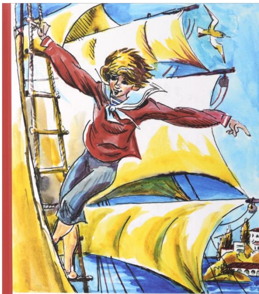
ВЛАДИСЛАВ КРАПИВИН ОСТРОВА И КАПИТАНЫ Граната