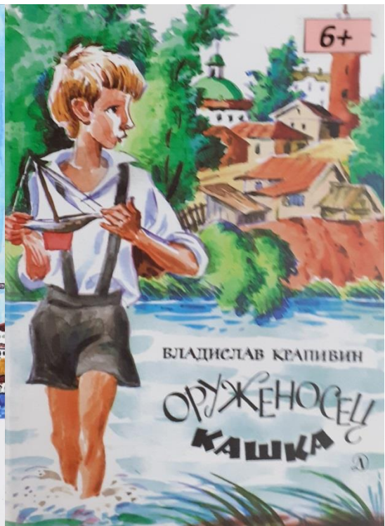
ВЛАДИСЛАВ КРАПИВИН ОРУЖЕНОСЕЦ КАШКА