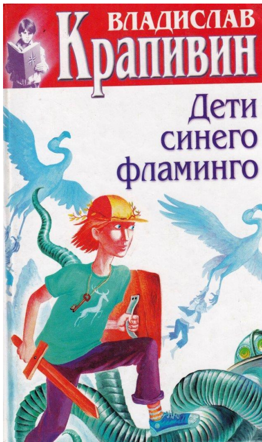
ВЛАДИСЛАВ Крапивин Дети синего фламинго